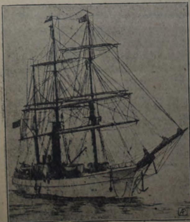
HACIA EL POLO AUSTRAL. — BOGANDO EN ALTA MAR, CON rumbo hacia el polo sur, está para estas fechas el navío que presentamos. Ciudad de Nueva York, que servirá de base a la expedición encabezada por el comandante Richard Byrd. La distancia que existe en Nueva York, punto de partida, y el punto de destino, es de 13.000 millas. El barco lleva a bordo 200 toneladas de comestibles, ropa y provisiones de índole diversa para los miembros de la expedición