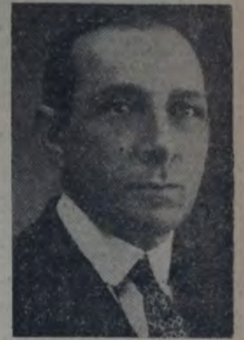
EL INTENDENTE SCHIFFRINO

El intendente municipal de La Plata, ante el requerimiento periódico acerca de cual sería su actitud frente a la sustracción de los adoquines efectuada por carteros que dicen obedecer órdenes del director del corralón municipal, manifestó que obligaciones ineludibles le impedían proceder de inmediato y que, por el momento, no tenía más información que la dada por los diarios.