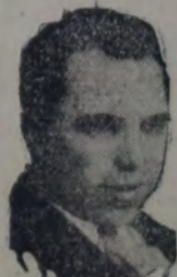
J. L. BAIRD, UNO DE LOS PRIMEROS EN OBTENER RESULTADOS prácticos en el campo de la televisión, ha logrado transmitir imágenes en sus colores naturales. Véase aquí demostrando uno de sus aparatos receptores. En la transmisión de imágenes policromas surge primero, ante el espectador, una imagen roja, después una azul y finalmente una amarilla. Mediante estos tres colores fundamentales se derivan los compuestos.