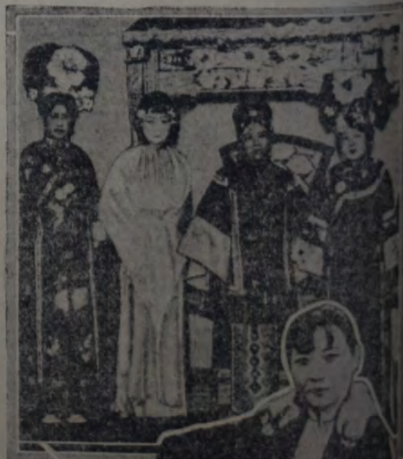
LAS CHINAS RENUNCIAN A LAS MODAS CONTEMPORANEAS por considerarlas exponentes de barbarismo. — Las mujeres chinas han resuelto renunciar a las modas de París, Londres y Nueva York, dando preponderancia a las que heredaron de los tiempos de Confucio. Madame Chian-Kai-Shek, esposa del comandante en jefe del ejército nacionalista, a quien puede verse en la parte inferior del grabado, está prestando su apoyo a las asociaciones femeninas que se han formado en la galestra de la moda en pro de las viejas tradiciones nacionales. Un comité, de reciente creación, se encarga de legislar en asuntos relativos a la indumentaria femenina y a la conducta que deben observar las damas en casamientos, funerales y bailes. En la parte superior del grabado figuran maniqués exhibiendo vestidos aprobados por el comité. No sólo se extiende la campaña contra los vestidos de faldas cortas y bajos descotes, sino también contra el carmin para los labios y uñas, y contra los zapatos de tacones altos. Oportuno es decir que el comité a que aludimos está compuesto únicamente por representantes del llamado sexo feo. Sus estatutos, sin embargo, están siendo acatados por la mayoría de las chinas.