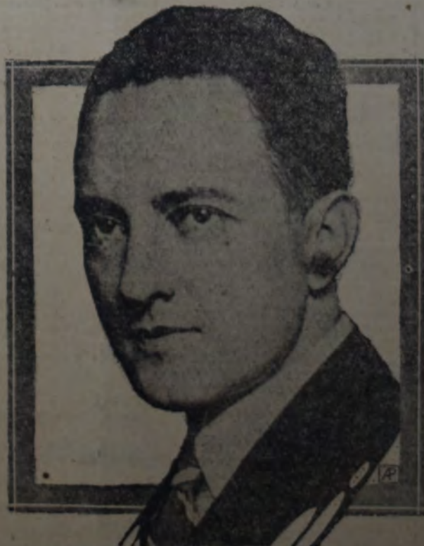
UN AVENTURERO. — ESTA ES LA ULTIMA FOTOGRAFIA TOMADA del comandante Richard E. Byrd, héroe de un vuelo transatlántico y jefe de la expedición organizada por él al polo antártico