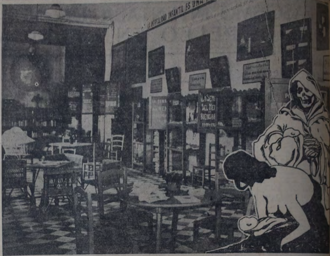
UNA VISTA DE LA EXPOSICION DEL CLUB DE MADRES INAUGURADA AYER. A LA DERECHA: AFFICHE DE PROPAGANDA PARA DESPUN- tar la preocupacion por el problema de la mortalidad infantil, usado por el Club de Madres.

En el día de ayer comenzaron los ac- tos en celebración de la Semana del Ne- ne, que desde el año 1917 y bajo los aus- picios del Club de Madres, se realiza anualmente. La Semana del Nene ha si- do instituida, como se sabe, con el laudable propósito de propender a la disminución de la mortalidad infantil y de mejorar la raza, mediante la difusión de las más modernas nociones de higiene.